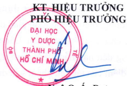
Ngô Quốc Đạt